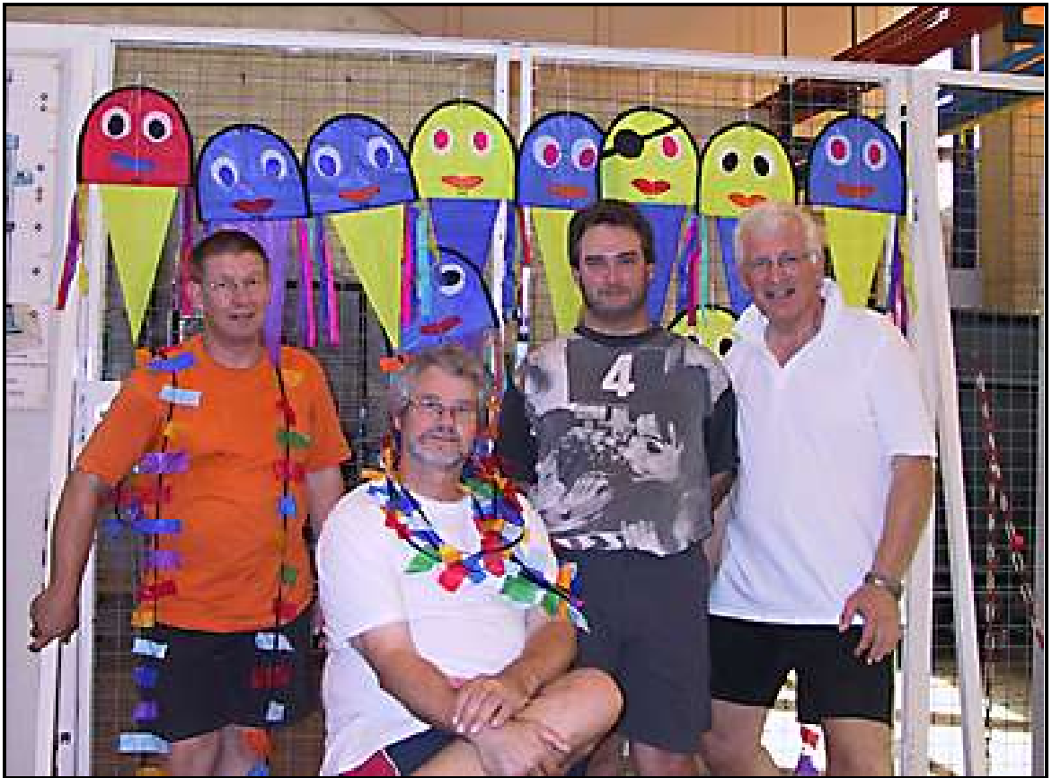
... und nach dem Workshop wurde der Käfig wieder aufgemacht

drachen am Himmel zu sehen waren. Am Nachmittag wurde dann sogar der Himmel blau und wir genossen die Sonne. Gegen 17 fingen wir dann an, alles wieder zu verpacken und fuhren dann (leider) wieder heimwärts. Bei dem tollen Wetter wären wir gerne geblieben. (Michael & Ute Lorenz)