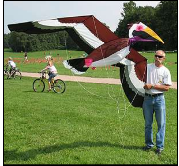
Öjendorf _ Ein Pelikan von Joel Scholz