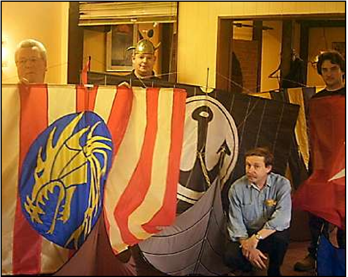
So, nu sinn se fertich. Vor Anstrengung sind sogar die Hörner verbogen!