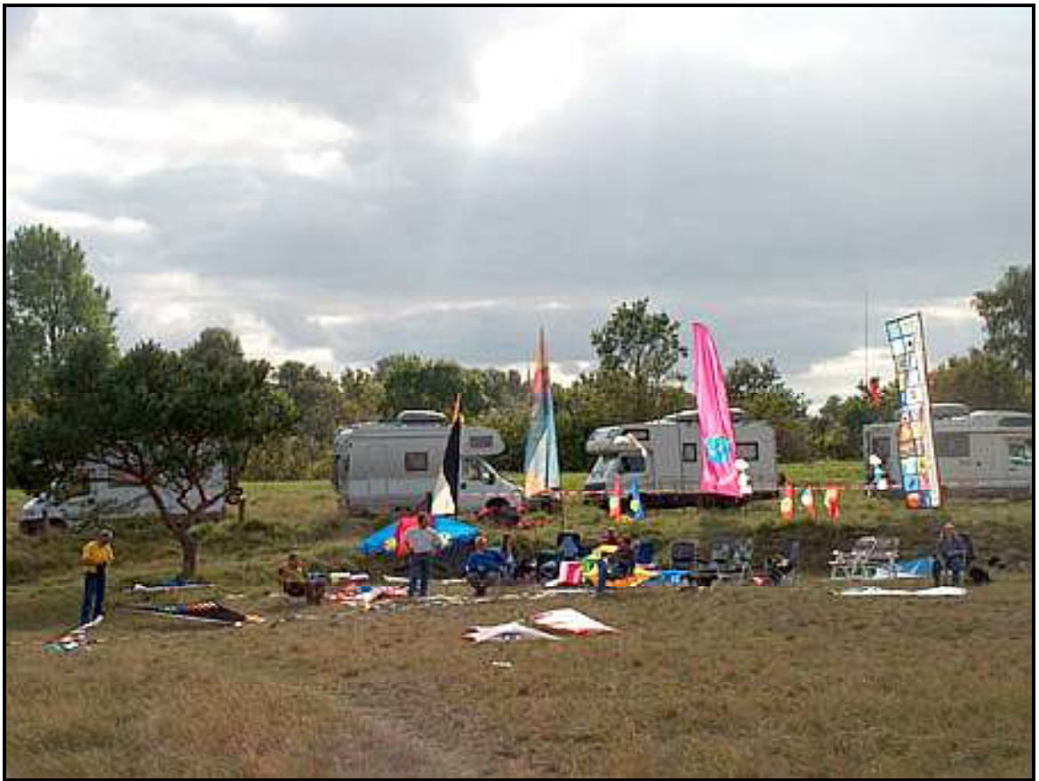
Die Wagenburg in Howacht, Platz ist wohl genug da!

Am Samstag hatten wir morgens sehr starken Wind aber ab Mittags schief der Wind dann ein. Morgens war der Himmel bunt gepflastert mit allen Starkwinddrachen, die die Drachentaschen hergaben.