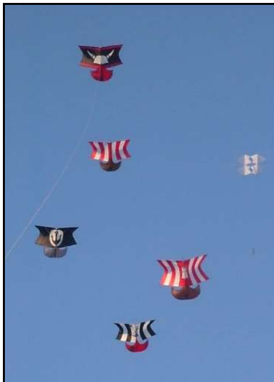
Sverker fliegen auch in Italien!

Das Wochenende war wie immer in Ferrara- alle Drachenflieger waren eine Familie. Herzlichkeit, die man nur auf