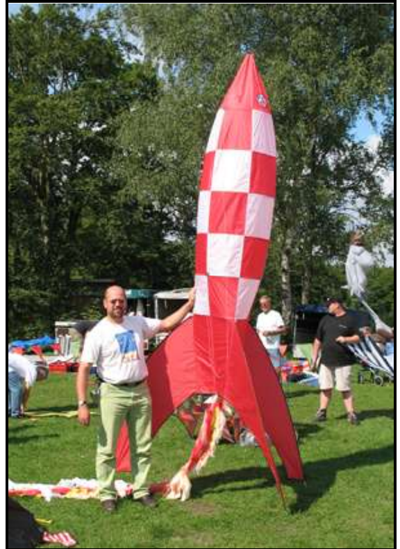
Pit mit seiner Rakete