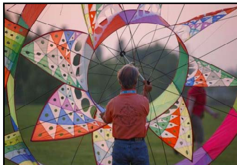
Ein toller Stern, ein tolles Foto!