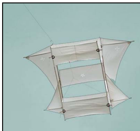
Hier ein originalgetreuer Nachbau des Gomes