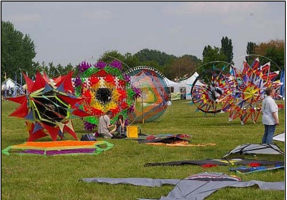
Eine farbenprächtige Wiese - für die Farbe braucht ihr aber das PDF-Flugblatt!

Den Freitag verbrachten wir bei sehr gutem Wind am Strand. Es war wieder ein tolles Bild, da wieder sehr