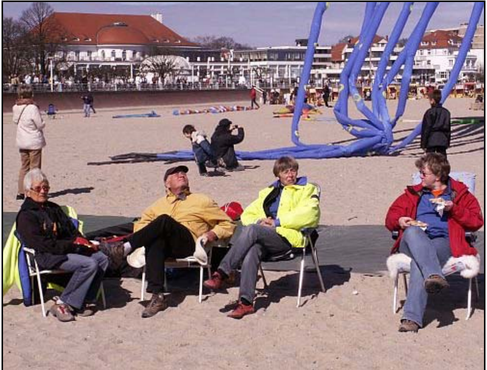
So kann man die Ostersonne richtig genießen!

Ostersamstag: Blauer Himmel, lauer Wind. Die Drachengruppe Hamburg war zahlreich anwesend und am späten Vormittag auch optisch auffällig, da Bernd netterweise die Banner mitbrachte und an die Anwesenden verteilte. 7 tolle Banner standen am Strand. Bei unruhigen Windverhältnissen haben wir den ganzen Tag Drachen geflogen. Um 17 Uhr mussten wir leider einpacken, um rechtzeitig beim Abendessen zu sein. Der Abend klang gemütlich im Reetdachhaus, mit Gesellschaftsspielen, aus.