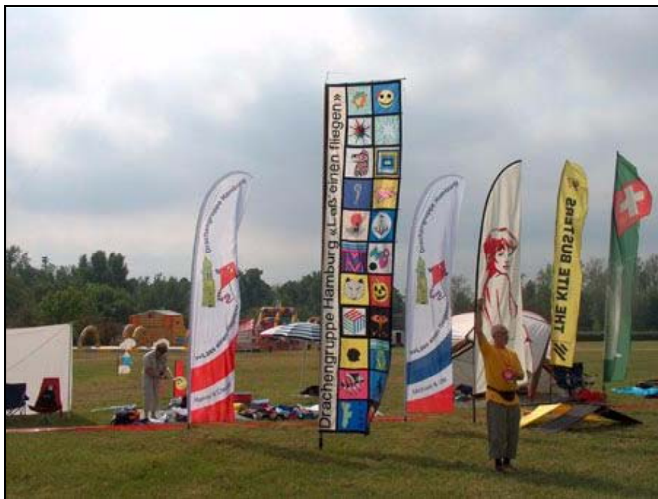
Wohin Sie auch reisen - unsere Banner sind schon da!