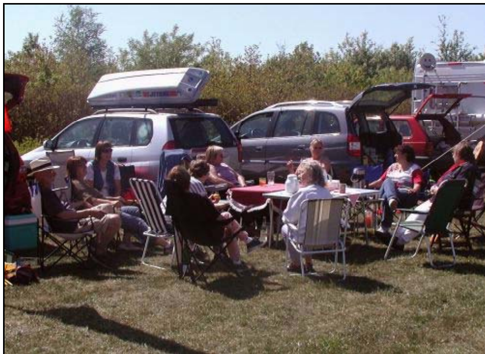
Man sieht es: ein offensichtlich gemütliches Drachenfest!