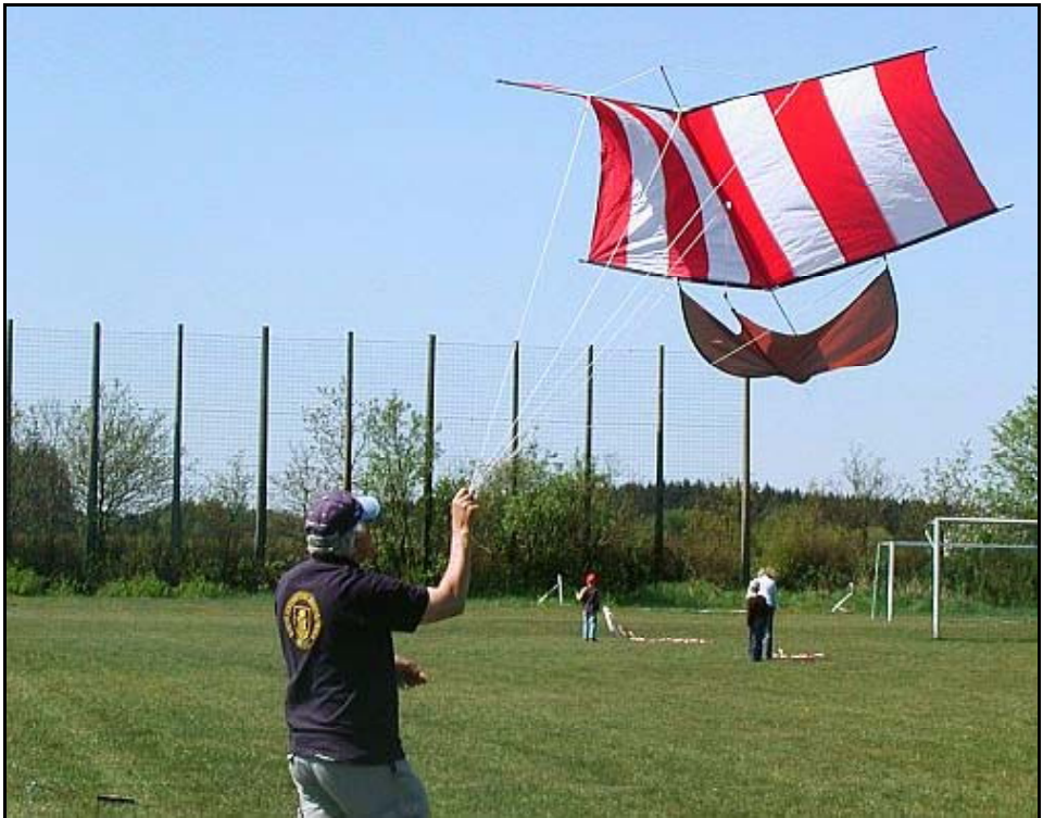
Soverker einmal da, wo er hinpasst: Am Strand der Ostsee lebten auch die Wikinger