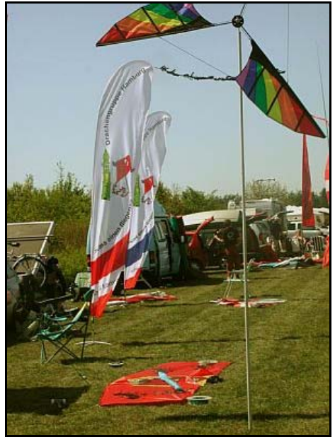
Die Wiese, mit Banner

Alle Anderen flogen auch mehr Stablose und Kastendrachen. Beim Einsatz meiner Drachenfähre hatten wir