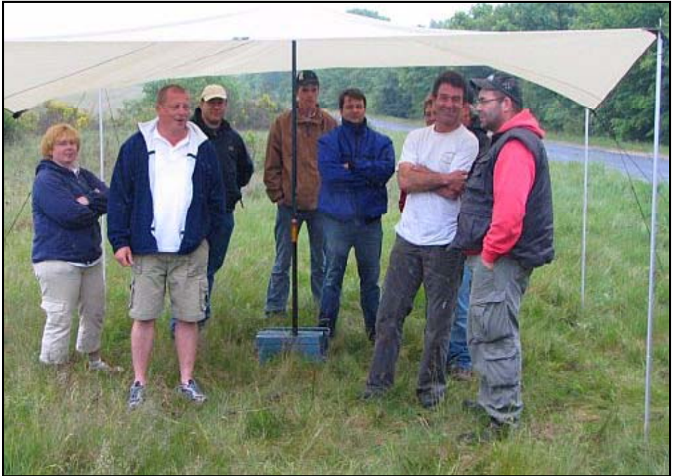
Man gut, dass das Zelt da war - nasse Füße gabs trotzdem!

Der Initiative von Chris zum Drachenfliegen am 19. Mai folgten fast 40 Personen. Wir fanden das ziemlich erstaunlich, da das Wetter nicht gerade zum Drachenfliegen einlud. Wir waren auch kurz davor, zu Hause zu bleiben, da es beim Aufstehen schon regnete. Da wir Chris aber versprochen hatten, das wir nach Uelzen kommen, haben wir uns in unser Wohnmobil gesetzt und sind losgefahren, ca. eineinhalb Stunden Fahrt brachten wir bei Regen hinter uns.