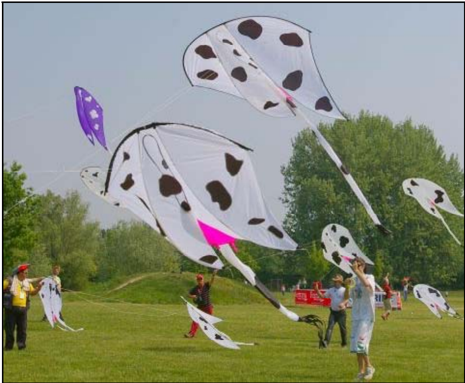
Sieht aus wie Kuh-Felle: Eine originelle Idee für einen „Gruppen-Drachen“ !

Wir fahren nach dem Drachenfest in Ferrara weiter nach Cervia. Wir wollten uns selbst davon überzeugen, dass das Flugfeld größer als bei unserem ersten Besuch war. Erzählt wurde es uns schon von verschiedenen Seiten. Und es stimmte, das Flugfeld ist jetzt bestimmt 3mal so groß wie vor 3 Jahren! Er ist zwar immer noch eingezäunt, aber durch die wesentlich größere Fläche fällt es nicht mehr so ins Gewicht.