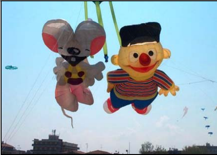
Ernie und die Diddl-Maus (die übrigens im Original aus Geesthacht stammt) waren also auch in Cervia- allerdings hier in extremer Grösse angefertigt!