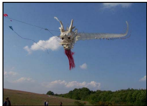
Weisse Centipede in Uelzen

Einen großen Dank an Chris, der so viele dazu gebracht hat, auch weite Wege in Kauf zu nehmen, um nach Uelzen zu diesem Drachentreffen zu kommen. (Ute & Michael Lorenz)