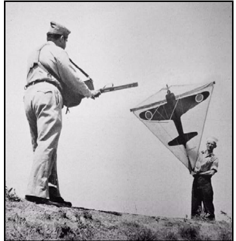
Vor dem Start - man beachte den aufwendigen Steuermechanismus, wie wir heute wissen, ist er unnötig.

Auf dem Segel des Drachen war ein Flugzeug abgebildet, mal mit japanischen Kennzeichen und mal mit Flügeln, wo das deutsche Balkenkreuz abgebildet war. Der Rest des Segels war grünlich oder blau, so das der Hintergrund mit dem Segel eins wurde und nur das Flugzeug zu sehen war. Unten am Drachen befand sich eine