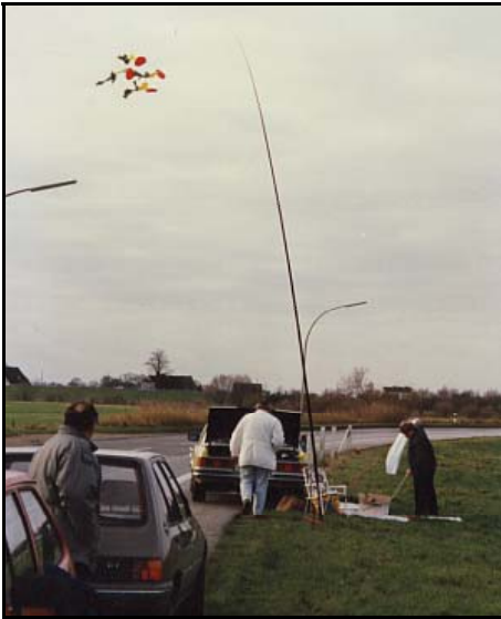
Adventsfliegen vor 20 Jahren - beachte Charlie's Leinenschmuck!