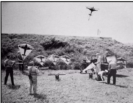
Ausbildung am Drachen

durch die Steuerleinen bewegte Finne, wodurch der Drachen die Richtung wechselte.