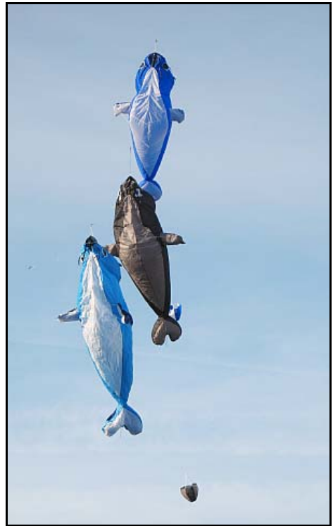
Drei Robben in Artlenburg - schön!

Am Sonntag um ca. 12 Uhr war unsere Robbe als Erste fertig. Jetzt fehlt nur noch die Waageschnur, doch die müssen wir noch anbringen. Wir mussten am Sonntag rechtzeitig los, so dass