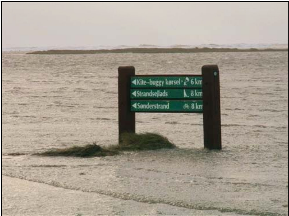
Sieht sehr überschwammt, feucht und ungemütlich aus - so recht für Kalduscher!