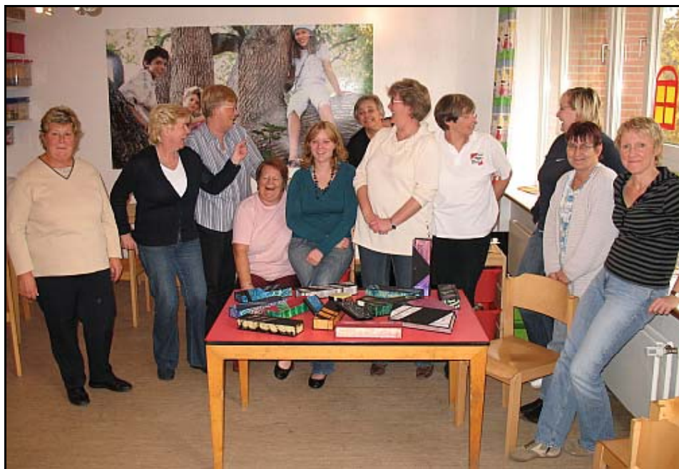
Also- wie man sieht macht der Workshop richtig Spass!