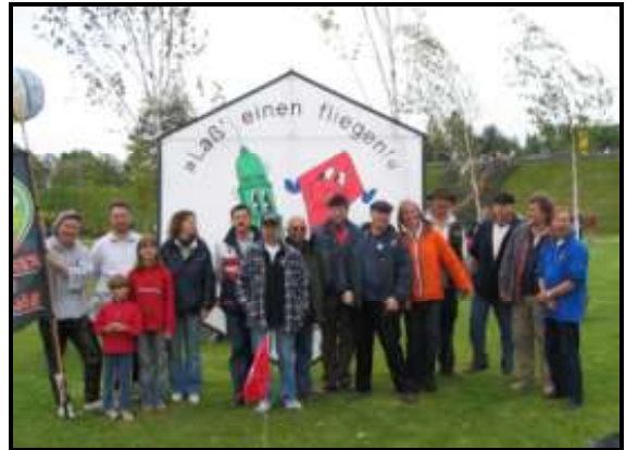
Die Drachengruppe war gut dabei!

Es hieß ab und zu mal mit den Anderen Abstimmen, damit die Leinenknoten nicht zu doll wurden. Auch war der Wind uns nicht gut gesonnen und pustete doch recht heftig, so das es zu einigen Abrissen kam. Aber alle Dra-