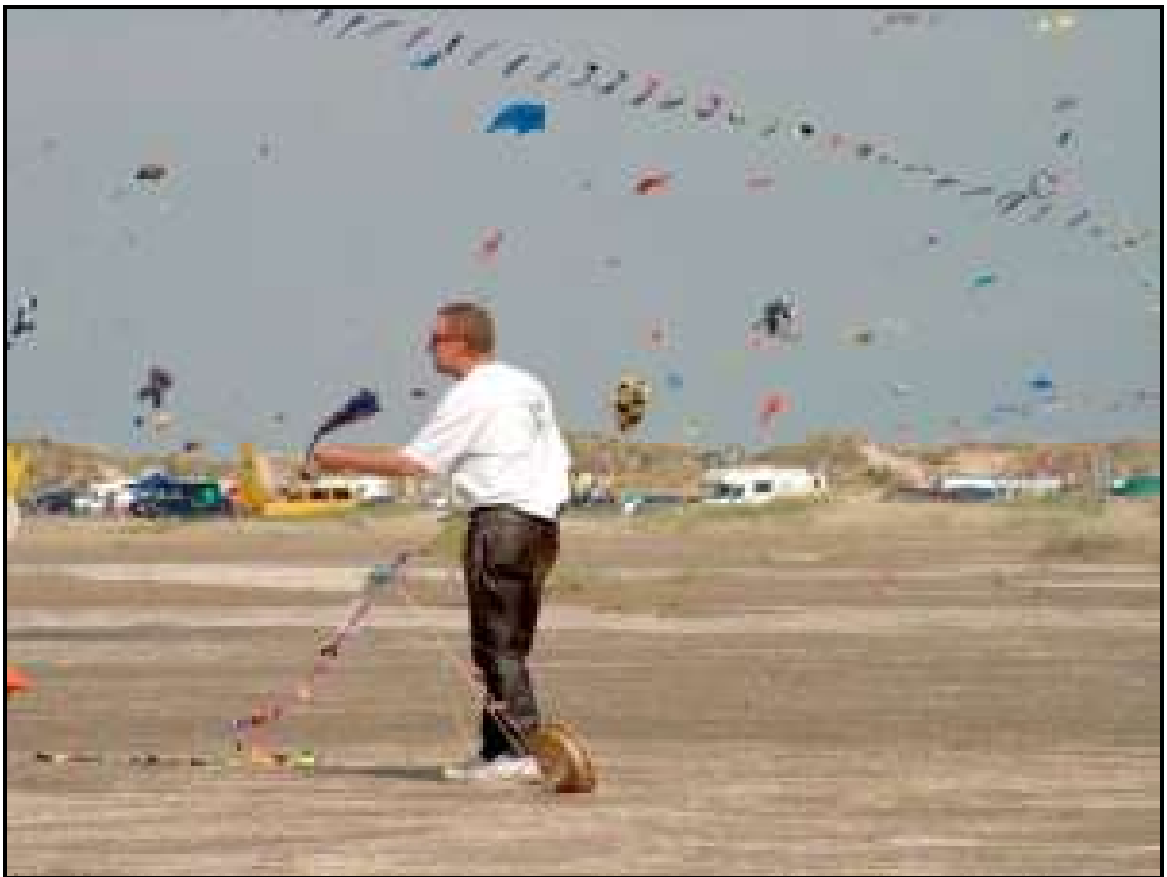
Rømø Strand bei gutem Wetter - davon können wir jetzt nur träumen . . .

Endlich war es wieder so weit, Rømø stand auf unserem Wochenendprogramm. Die Wettervorhersagen waren zwar in diesem Jahr nicht ganz so toll, aber nichts desto trotz zog es uns auf die INSEL. Wir fuhren am frühen Freitag Nachmittag los, drei Stunden später waren wir dann da. Unvergleichlich diese Luft, endlich wieder Seeluft! Erst einmal ging es ans Begrüßen der schon anwesenden Drachenfrende. Später am Abend fing es dann leider an zu regnen, so dass wir die Stühle und Tische auf die Schnelle wegräumten und uns bei Suse und Hanjo im Wohnmobil drängelten.