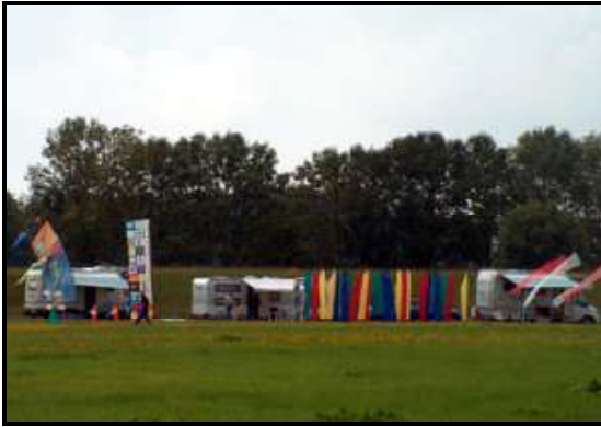
Die Wohn-Wagenburg

Als dann am Abend der Aufruf kam, der Grill sei an, fing dann auch endlich die Sonne an zu scheinen und der Wind frischte auf, so dass endlich Drachen geflogen werden konnten. Nach ungefähr einer dreiviertel Stunde holten wir unsere Drachen wieder herunter, um dann mit unseren Utensilien zum Grill zu gehen.