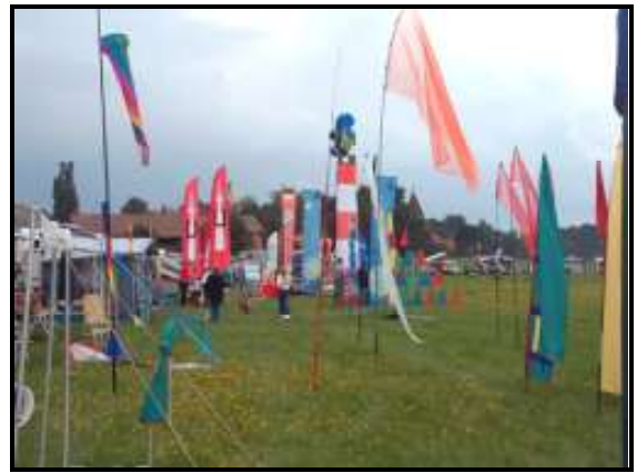
Noch keine Stiefel zu sehen