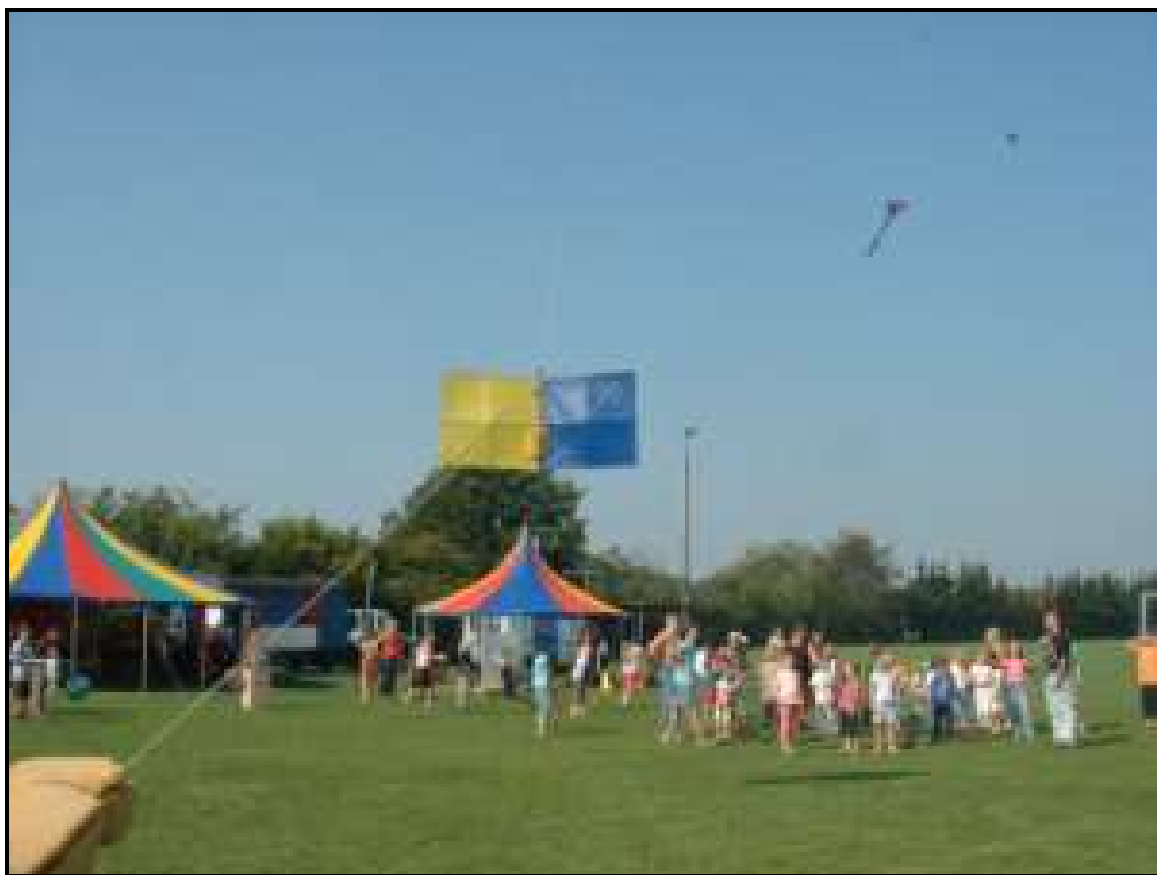
So soll es sein: Die Kinderschar wartet auf den Bonbon-Regen!

Am Wochenende 16. und 17. September war es so weit, seit 10 Jahren veranstaltet die Drachengruppe „Skywalker-Bienenbüttel“ ihr Drachenfest in Hohnstorf auf dem Sportplatz. Für mich ist es das dritte Jahr, in dem ich dabei bin. Nachdem Christiane mir den Termin genannt hatte, war er dick im Kalender angestrichen. Am Freitag wurde der Wohnwagen gepackt und so konnte die Männerrunde am Samstagmorgen losfahren. Jenni und Andrea konnten diesmal nicht mitkommen.