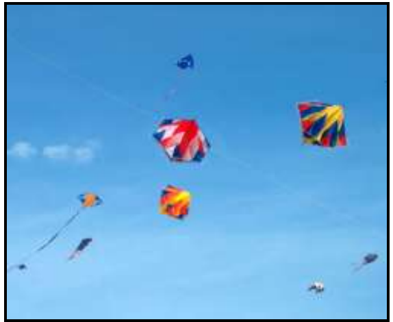
Blauer Himmel über Rømø - hier leider nur in grau.

Wir wollten dann noch zum Nachtfliegen zu Fuß wieder zum Strand hinunter gehen. Als wir dann wieder unten waren, fing es dann leider doch noch zu regnen an, so dass wir ziemlich schnell wieder auf dem Platz waren.